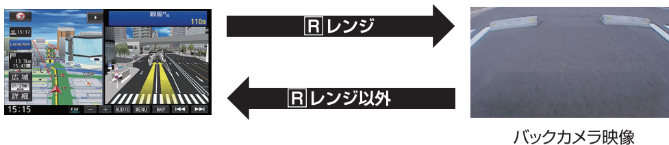
バックカメラ映像

※本製品はノーマルビューのみのアングルになります。他のアングルに切り替える事は出来ません。