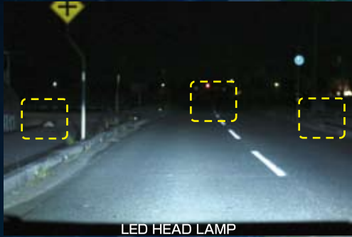
LED HEAD LAMP

HIR2タイプ：4800lmの明るさで、ハロゲンバルブと比較した時にワイド&ロングな照射を行い、路面を確実に照らします。(数値はバルブ2本分=車両1台分)