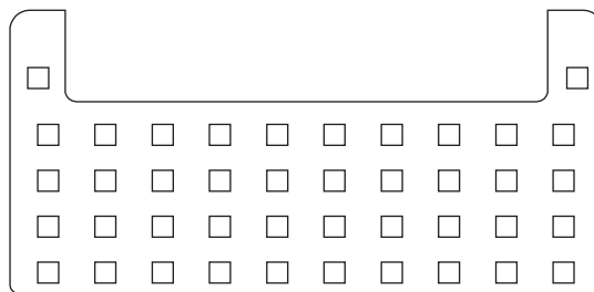
センターランプ 42SMD × 1